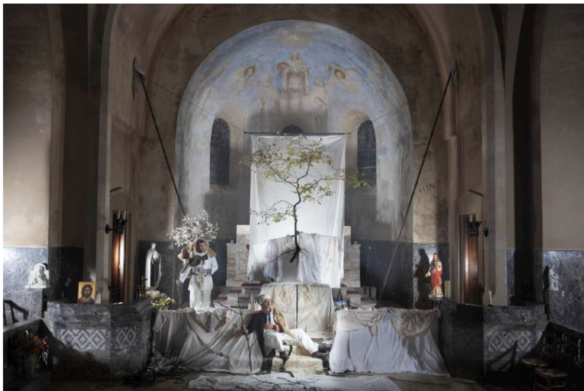
Photo réalisée par Nicolas HENRY le 10 décembre 2020 - Eglise de Lespinassière