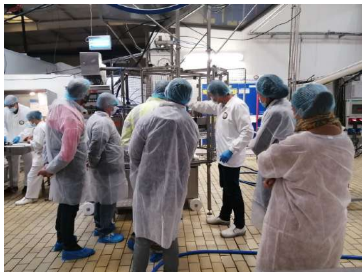
Visite de la SCOP La Belle Aude à Carcassonne par Emmaüs Lespinassière le 15 octobre 2020