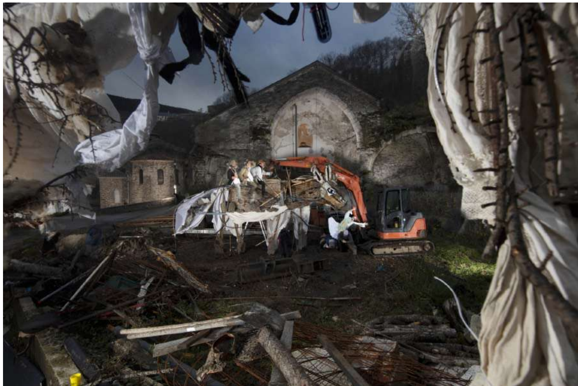
Photo réalisée par Nicolas HENRY le 9 décembre 2020 - Emmaüs Lespinassière