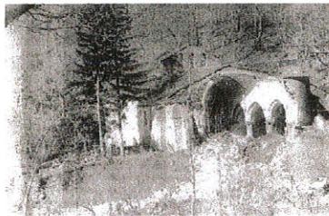
Après l'inondation de 1930

En 1846 le conseil municipal constate que « l'église menace ruine », « Quelle est trop petite », il décide alors de la réparer et de l'agrandir, seul le porche roman et la chapelle St Antoine seront conservés. Cette troisième église sera achevée en 1852, elle est ornée de statues en marbre de carrare représentant la Vierge et St Sébastien.