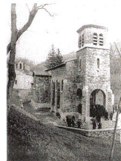
Inauguration en 1935