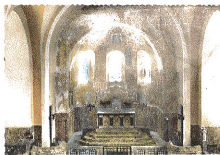
Chœur de la nouvelle église